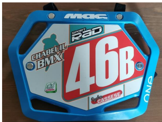
Plaque frontale cruiser